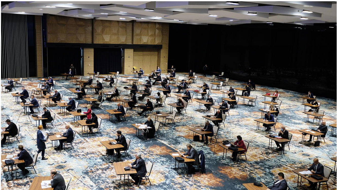
U Mostaru, 15.6.2020.